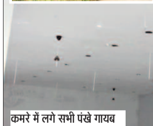
कमरे में लगे सभी पंखे गायब